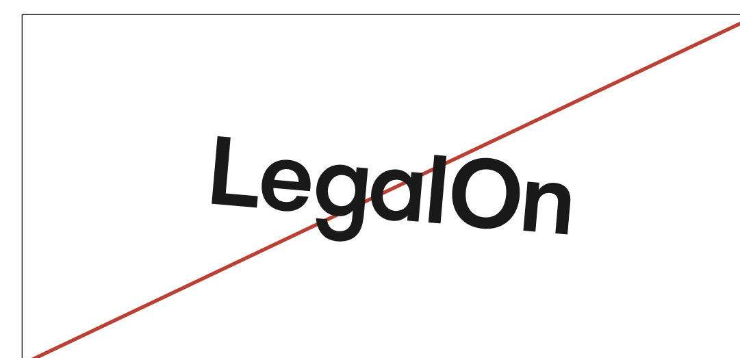
回転して表示する