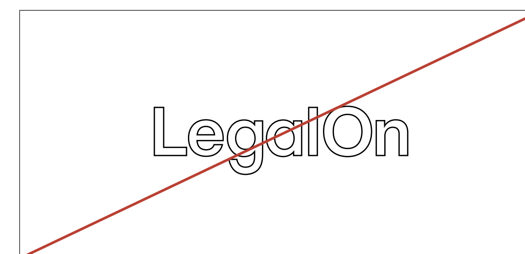
アウトラインで表示する